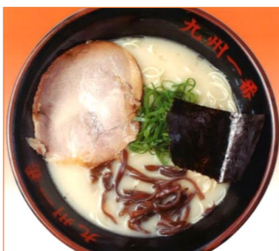
長浜ラーメン 724円 (税抜 670円)