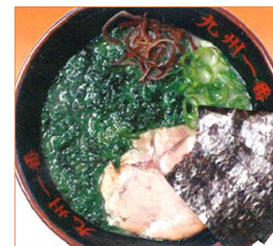
あおさラーメン 940円 (税抜 870円)