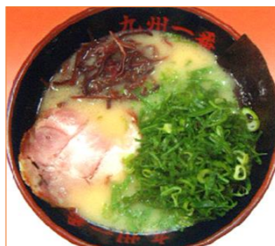
青ねぎラーメン 994円 (税抜 920円)