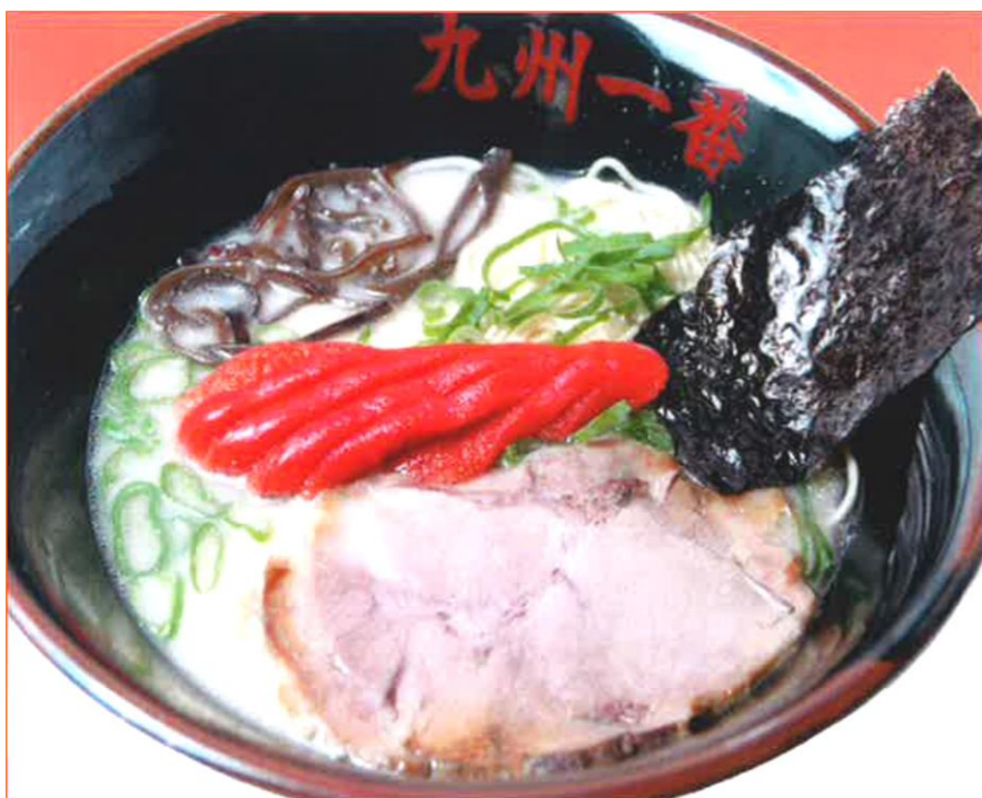
明太子ラーメン 1102円 (税抜 1020円)