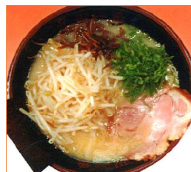
もやしラーメン 886円 (税抜 820円)