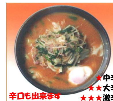
九州こく味噌麺 886円 (税抜 820円)

大盛 1036円 味噌替玉 150円 ★中辛 ★★大辛 ★★★激辛 辛口も出来ます