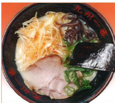
ねぎラーメン 994円 (税抜 920円)