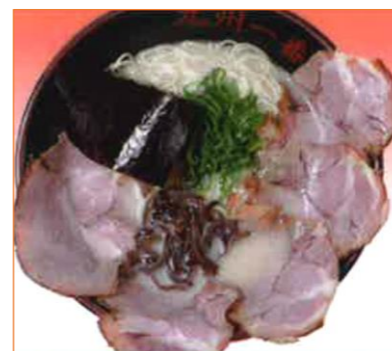
チャーシューメン 1102円 (税抜 1020円)