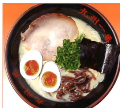
玉子ラーメン 832円 (税抜 770円)